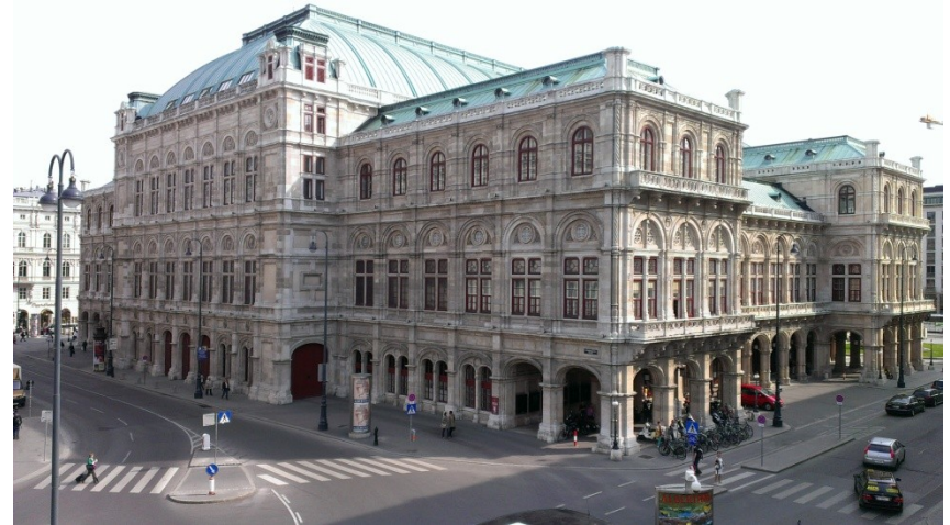
Ausblick von der Albertina